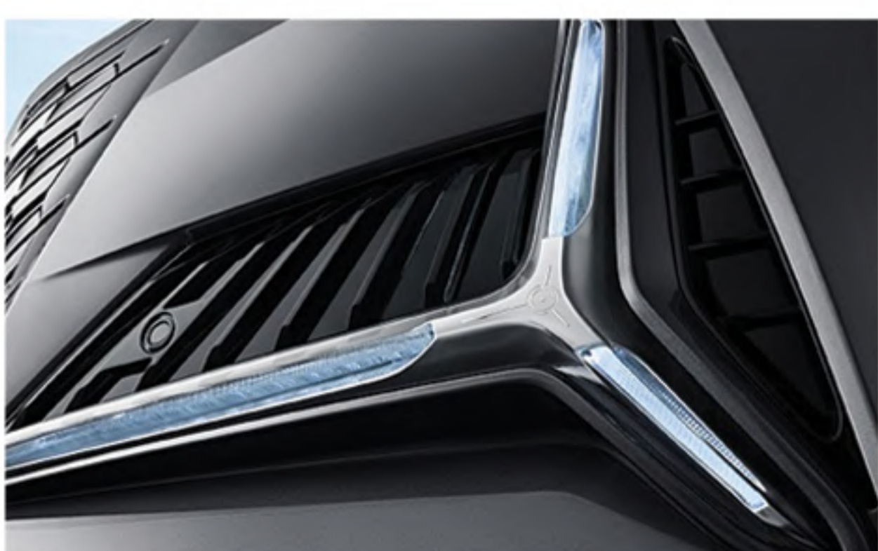
Feux De Circulation Diurne Trident Et Phares A LED Cuirassé