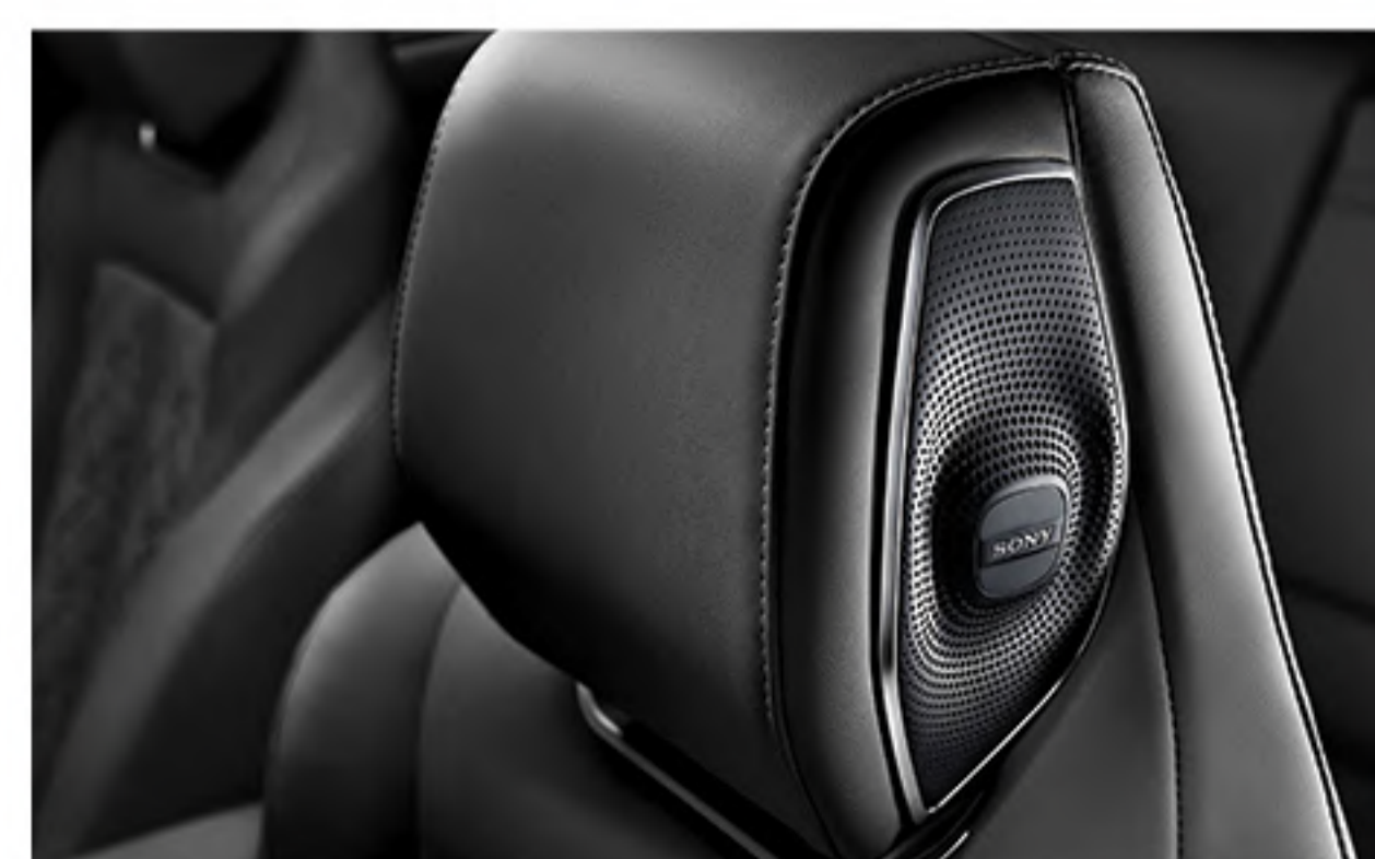
12-Speaker Premium Sony Audio System with Subwoofer and Amplifier