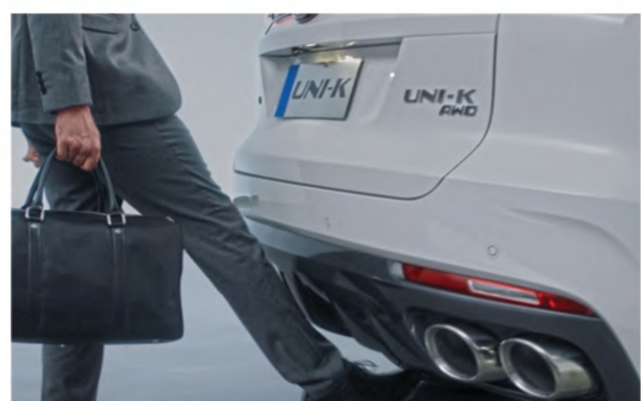
Electric Power Tailgate with Handsfree Kick-Open