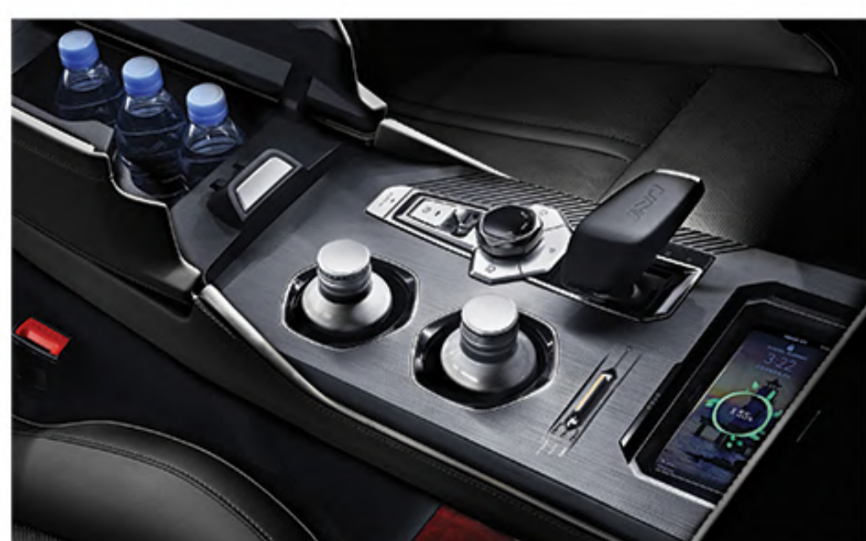
Spacious Center Console with 15 Watt High Speed Wireless Charging Pad