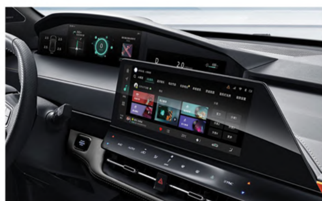
Smart Quadruple Screens 3.5" + 10.25" + 9.2" + 12.3" with 360° High Definition 3D Cameras with Dash Cam Recorder