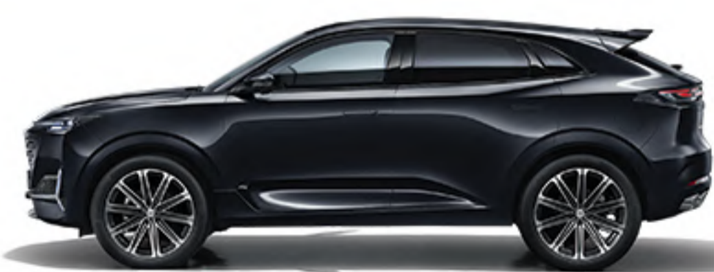
Noir Diamant Bleu