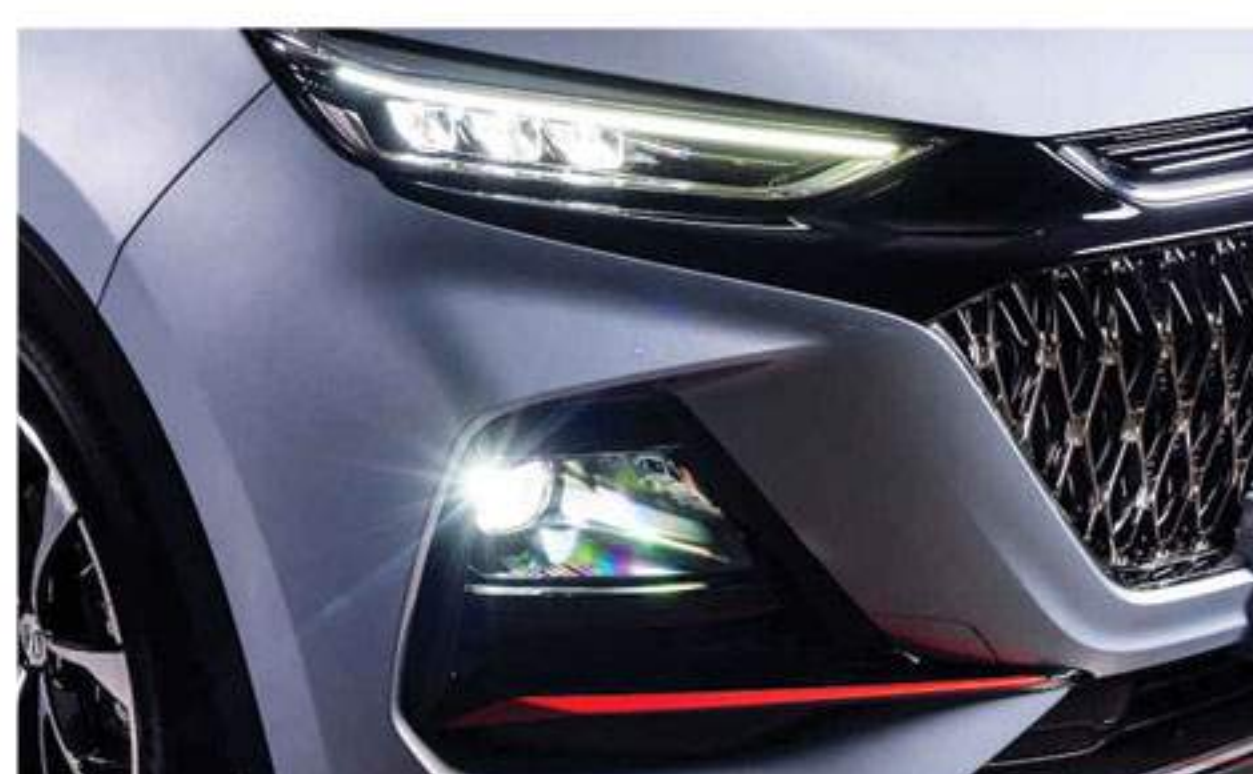
Phares À LED (Automatiques), Phares Automatiques Et Feu Arrière À Barre Lumineuse LED