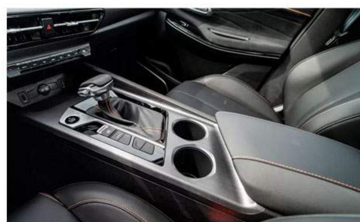
Kit d'Apparence Sportive Avec Démarrage Du Moteur Par Bouton-Poussoir