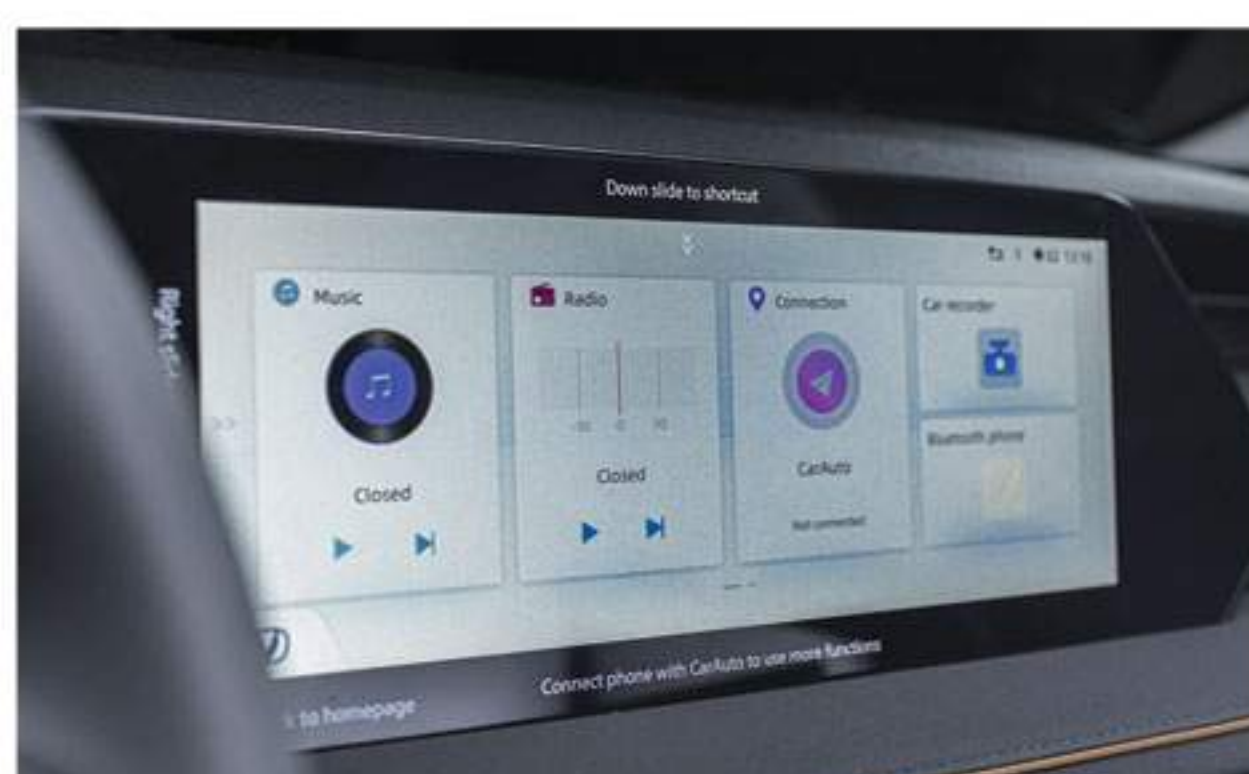
Écran Tactile Multimédia De 12,3 Pouces Avec Mise En Miroir Des Smartphones