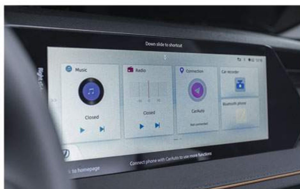
12.3" Multimedia Touch Screen With Smartphone Mirroring