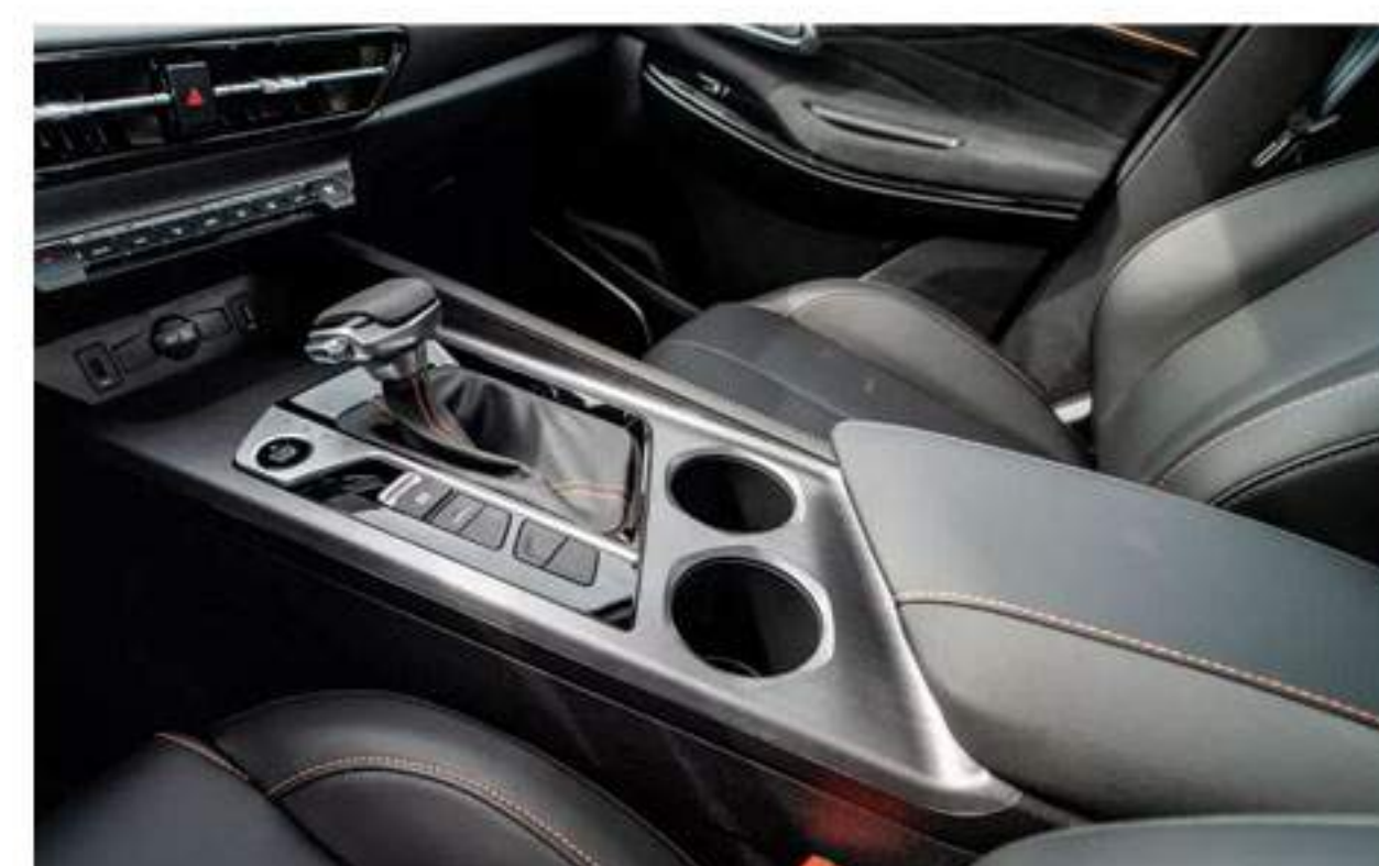
Sport Appearance Kit With Push Button Engine Start