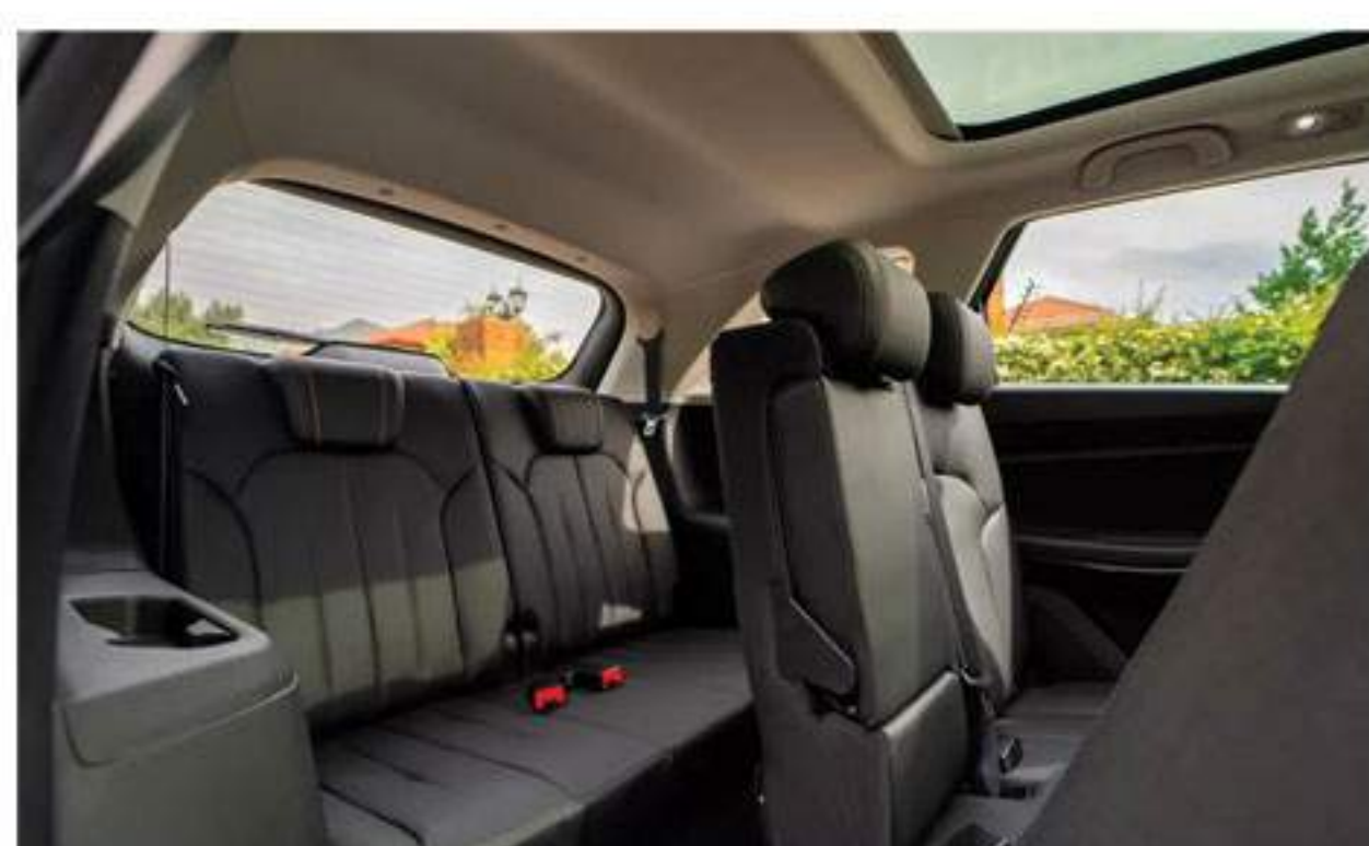
Sièges À 3 Rangées Offrant Amplement Espace Pour 7 Passagers