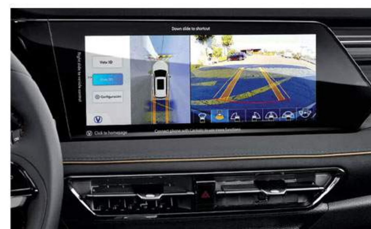
Caméras 3D Panoramiques À 360° Et Enregistreur De Caméra De Bord