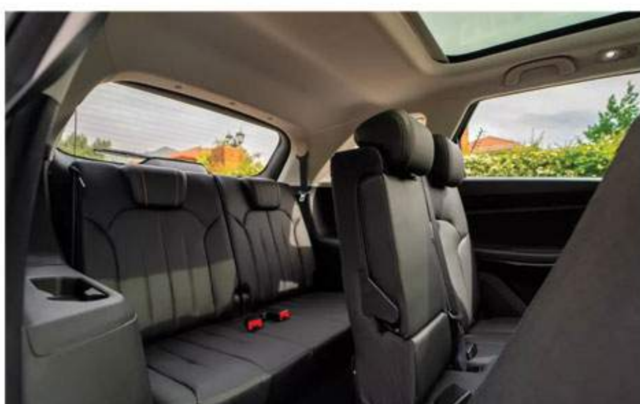
3-Row Seating With Ample Space for 7 Passengers