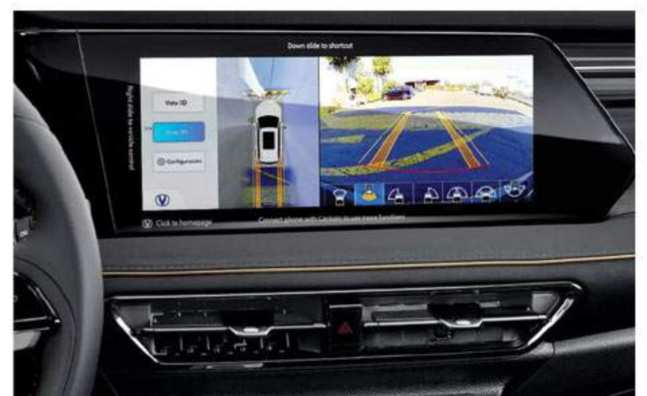
360° HD 3D Panoramic Cameras & Dash Cam Recorder