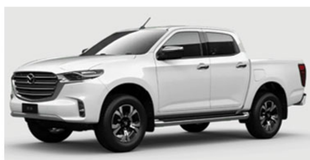
Blanc de Glace