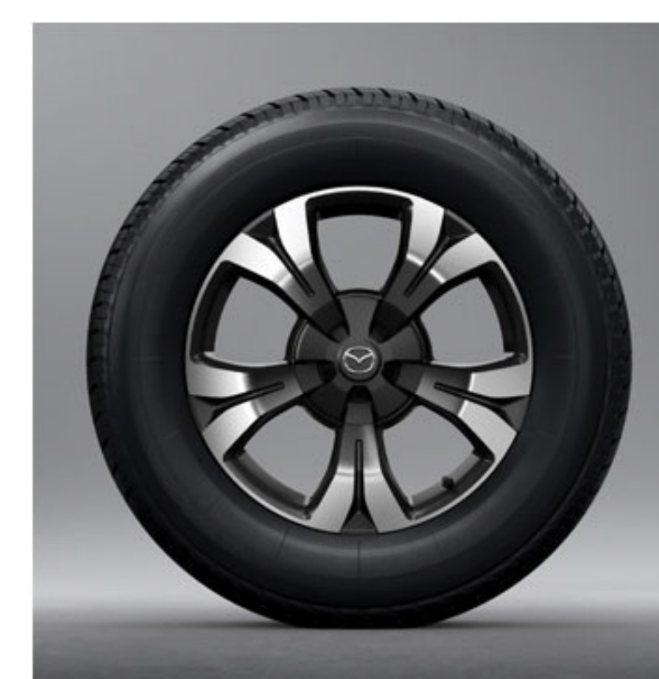
Jantes en Alliage de 18 Pouces Usinées à Deux Tons