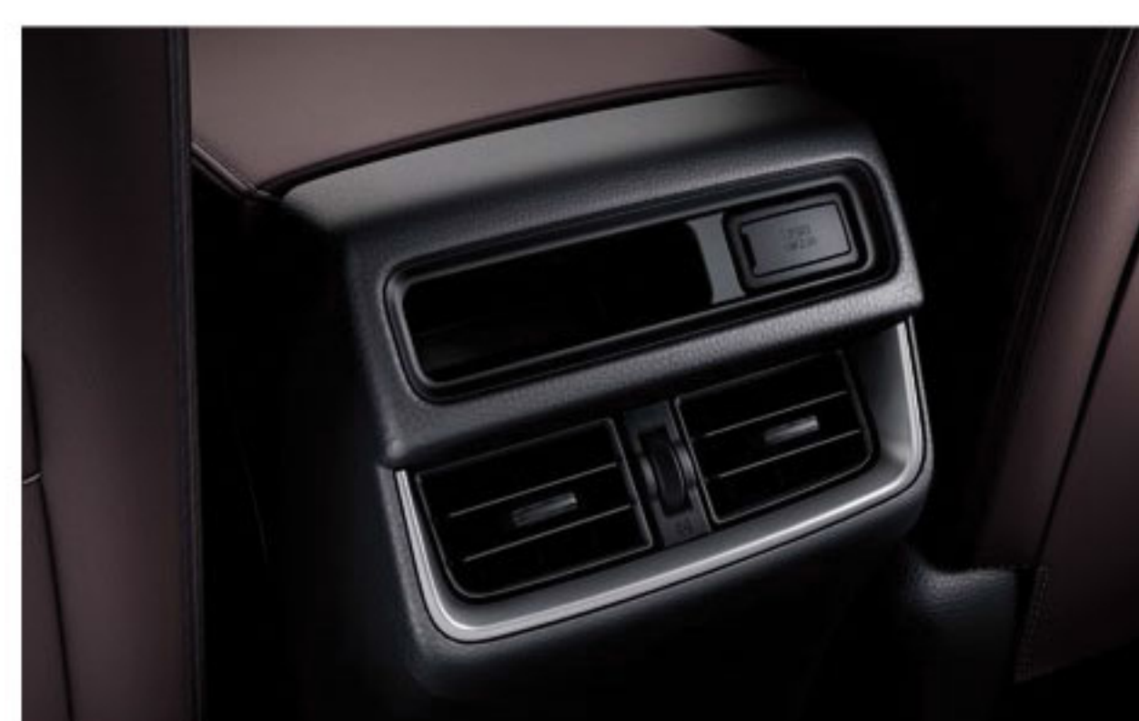
Climatisation à la Deuxième Rangée & Chargement USB