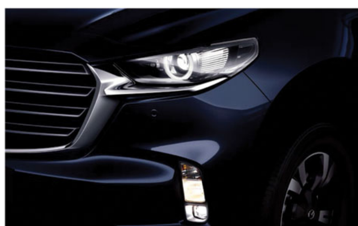
Phares à LED et Feux de Jour à LED (DRL)