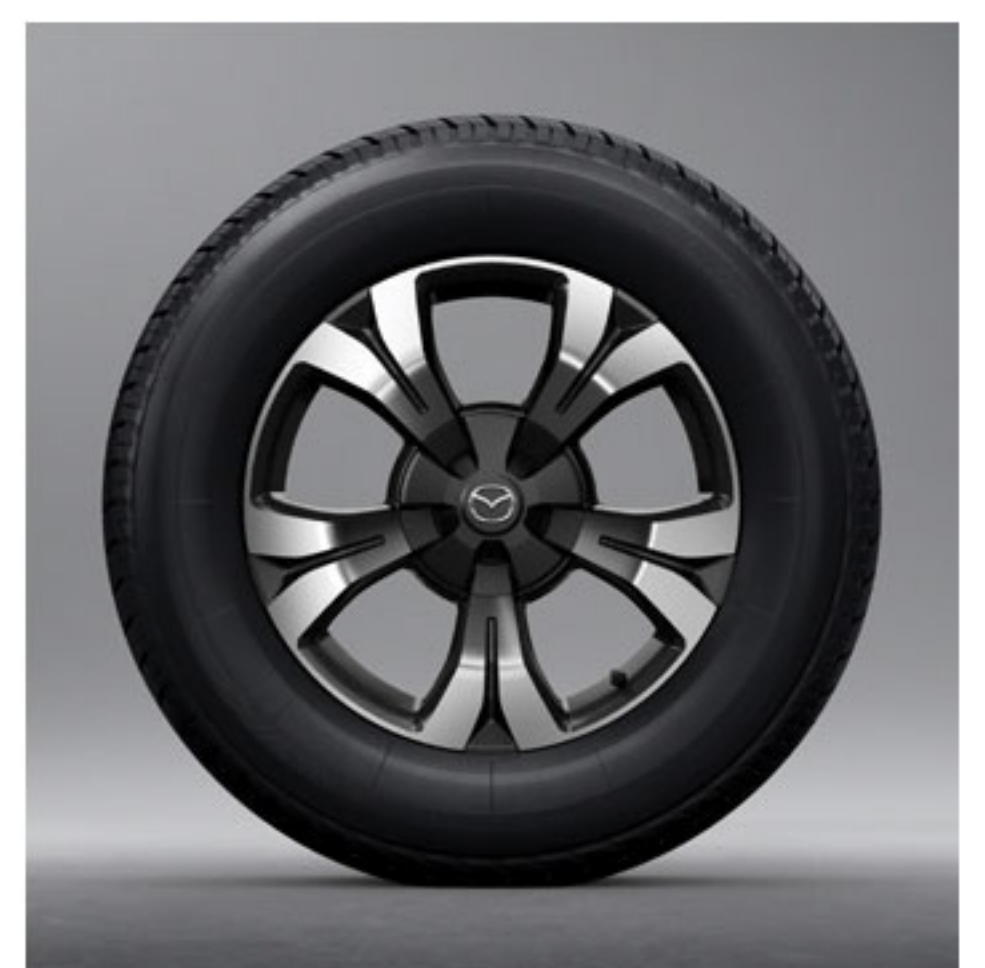
18" Machined Two Toned Alloy Wheels