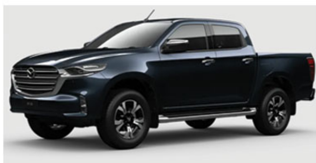
Bleu de Feu