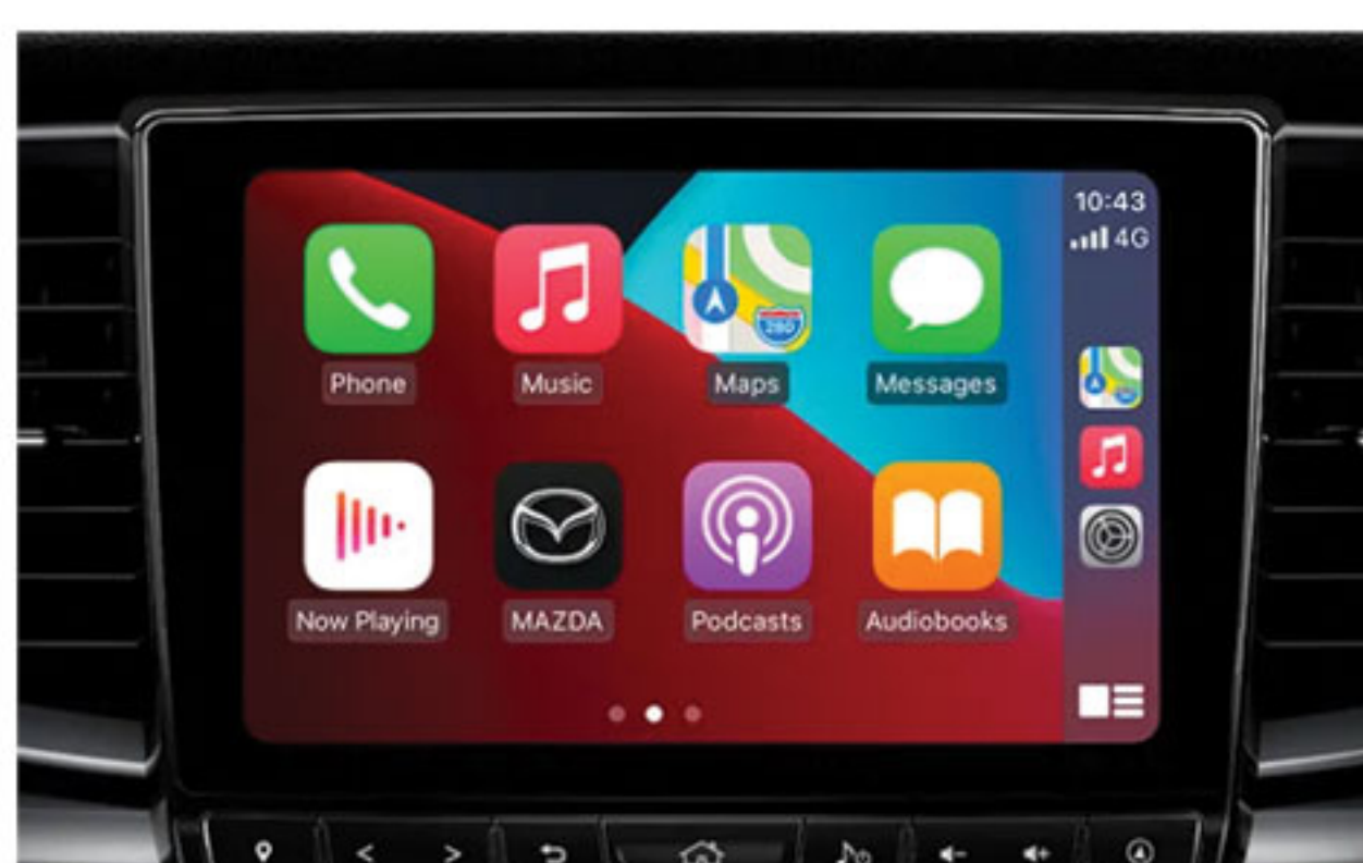
Écran Tactile Couleur de 9" du Système d'Infodivertissement Mazda Connect avec Apple CarPlay Câblé