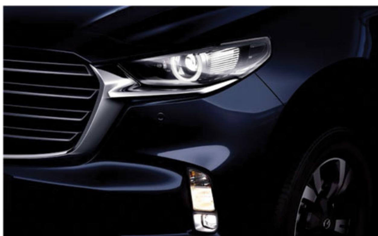
LED Headlights & LED Daytime Running Lights (DRL)