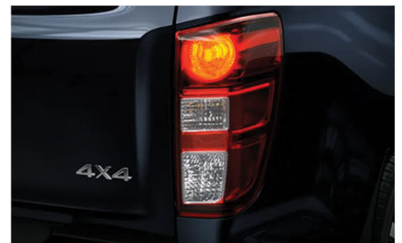
4x4 Drivetrain with Shift-On-The-Fly System Towing Capacity: 3500kg