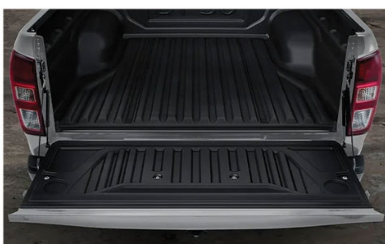
Bedliner avec 4 Crochets de Chargement Intérieurs. Capacité de Charge Utile : 1000kg