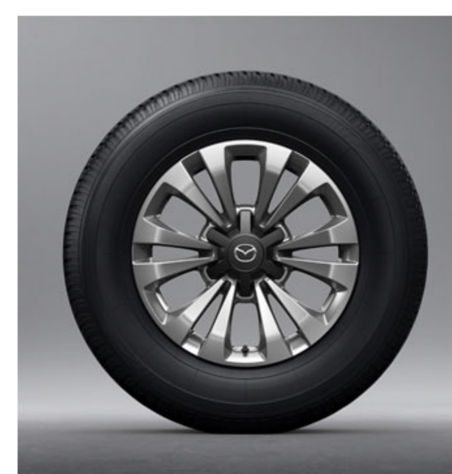
Jantes en Alliage de 17 Pouces