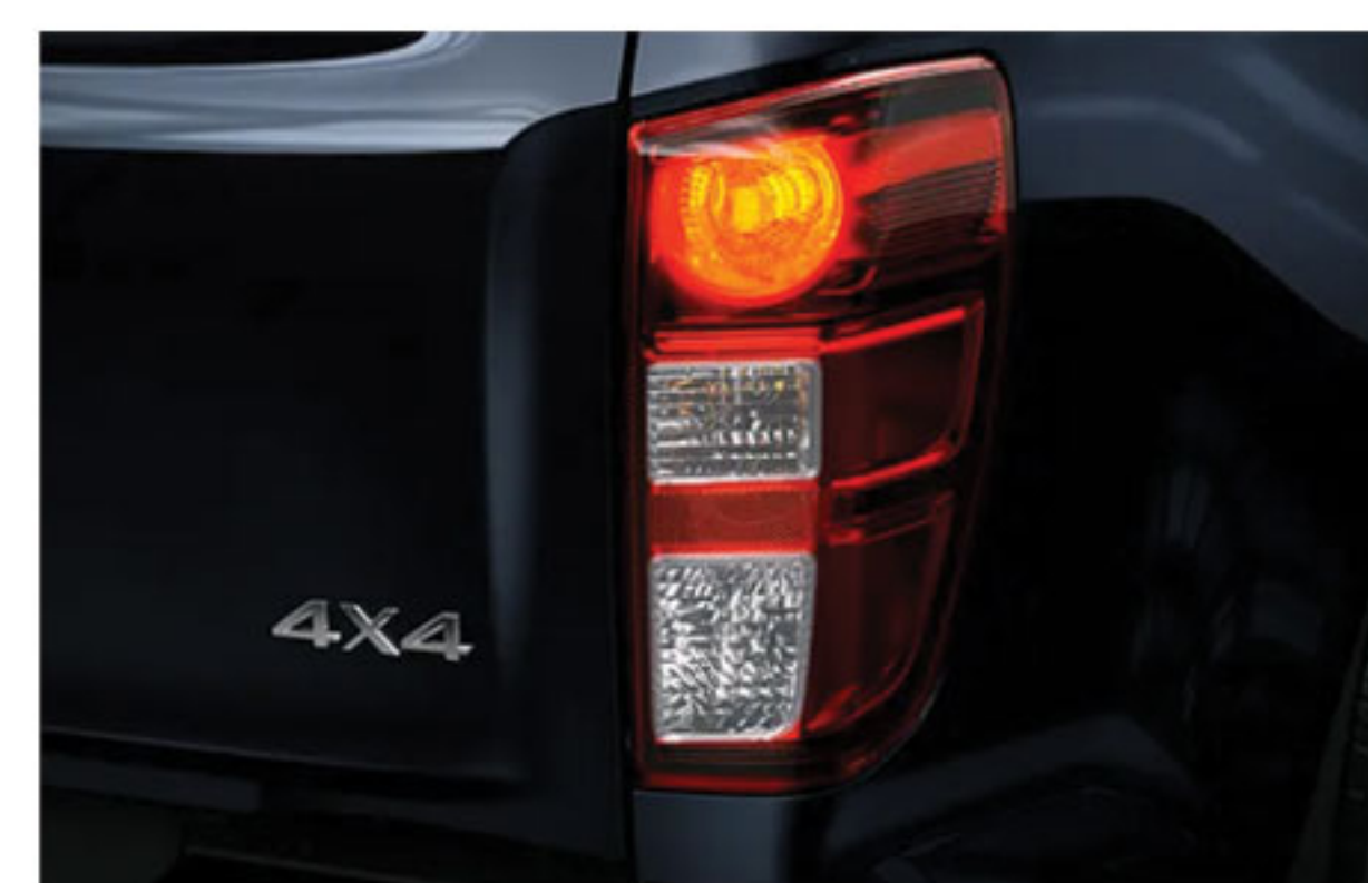
Transmission 4x4 avec Système de Changement de Vitesse à la Volée. Capacité de Remorquage : 3500kg